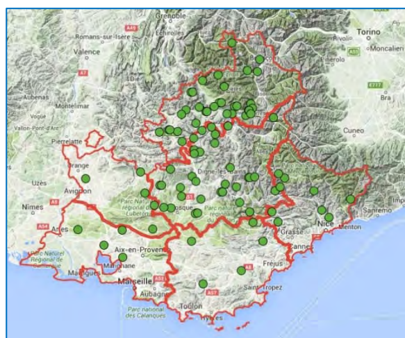
Région PACA : Localisation des installations en 2015

On note cette année encore des installations dans tous les départements de la région. Mais 74% des candidats en 2015 (51% en 2014) se sont installés dans l'un des deux grands départements ovins de la région : les Alpes de Haute Provence et les Hautes-Alpes (qui représentent 65% des demandeurs d'aide ovine en 2014). Si l'on compare le nombre d'installés en 2015 avec le nombre de demandeurs d'Aide Ovine, on constate un taux de renouvellement autour de 6-8% pour les départements 04, 05, 06 et 84 alors que les deux départements des Bouches-du-Rhône et du Var ont des taux beaucoup plus faibles. Ces taux ne sont pas stables sur les 2 années étudiées et ne permettent donc pas de conclure à des différences de dynamique d'installation entre départements.